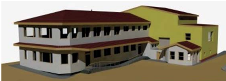
Nové kabiny - vize