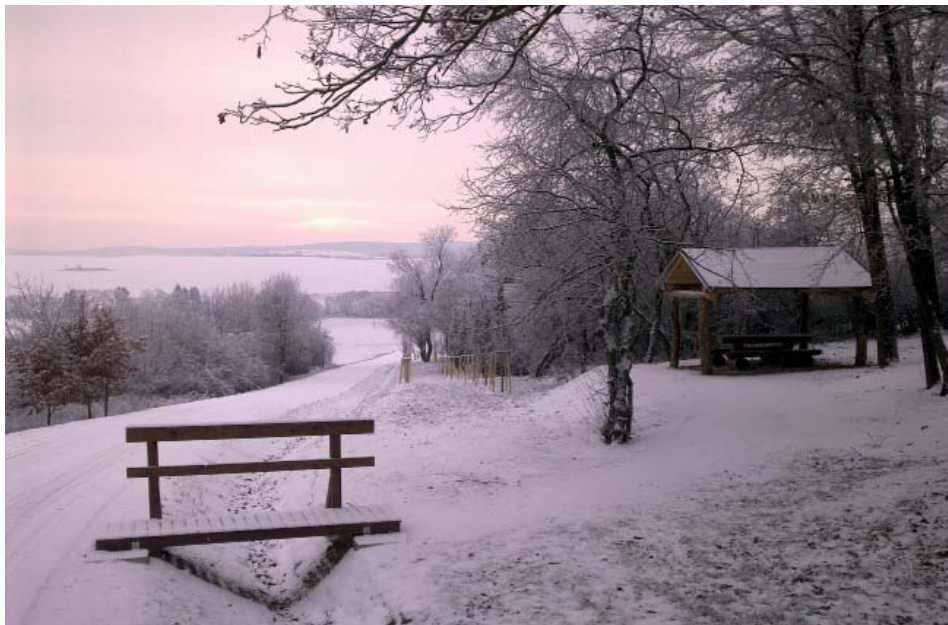
Zimní idylka na turistickém altánu „Buchlov“

Odměnou nám bude krásný rozhled po okolí, při němž můžeme vidět bližší cíle, např. obce Komárov, Bílovice, Svárov, Místřice a Velký Ořechov, město Otrokovice, nebo vysílače Topolná. Ale i cíle vzdálenější: západním směrem rozhlednu Rovninu nad Jarošovem, panorama Chřibů s rozhlednou Brdo a hradem Buchlovem. Jižním pak kopec Velký Lopeník a Velká Javořina. Pouze severní pohled nám zakrývá lesní porost.