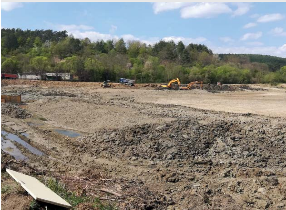
Na rybníku Hluboček, vybudovaného v padesátých letech minulého století, probíhá rekonstrukce s dotací EU přes Státní fond životního prostředí (SFŽP). Hotovo by mělo být do konce roku 2020.