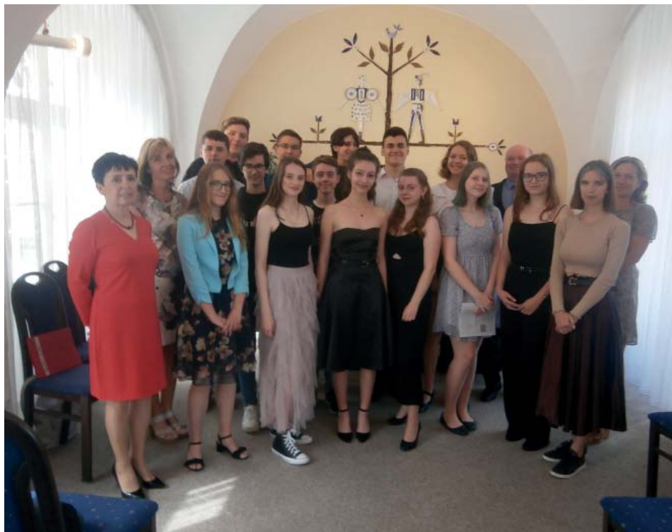
Slavnostní rozloučení s žáky 9. ročníku v obřadní síni obecního úřadu