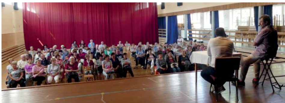
Srdcovky Zdeňka Junáka zaplnily březolupskou halu