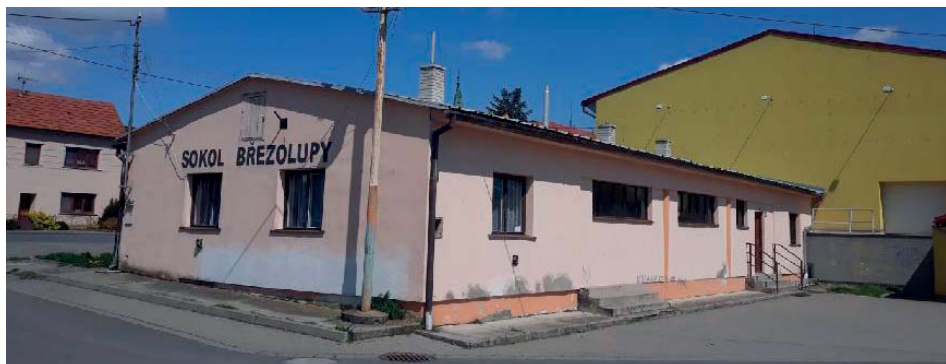
Před zahájením výstavby