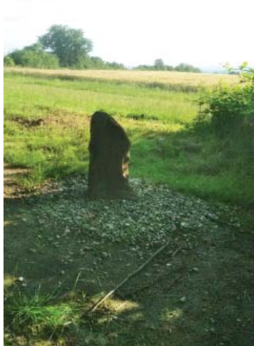
Kameň – léto 2020

Abychom se dostali na další hraniční bod, musíme se dobře posílit. Čeká nás výstup o 87 výškových metrů na délce 490 m a dostaneme se na tzv. „Lhotskou cestu“, tj. zemědělskou asfaltovou silnici vedoucí z Lapače na Lhotu. Poté si zase odpočineme při postupném 900 m dlouhém klesání travním porostem do údolí potoka Březnice. Při něm sestoupíme dokonce o metrů 98. Na konci této části naší cesty přejdeme hlavní silnici, mineme vpravo dům č. 423, který ještě patří, stejně jako bývalý dvůr Lapač do obce Březolupy, a poté musíme překonat potok. Po jeho levém břehu půjdeme proti proudu podél lesa, až do místa, kde na druhé straně silnice uvidíme část „Ráj“, tj. skupinu