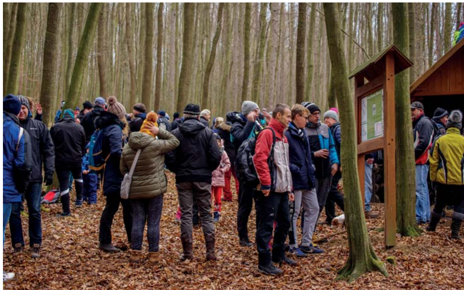
Výslap na hrad Šarov