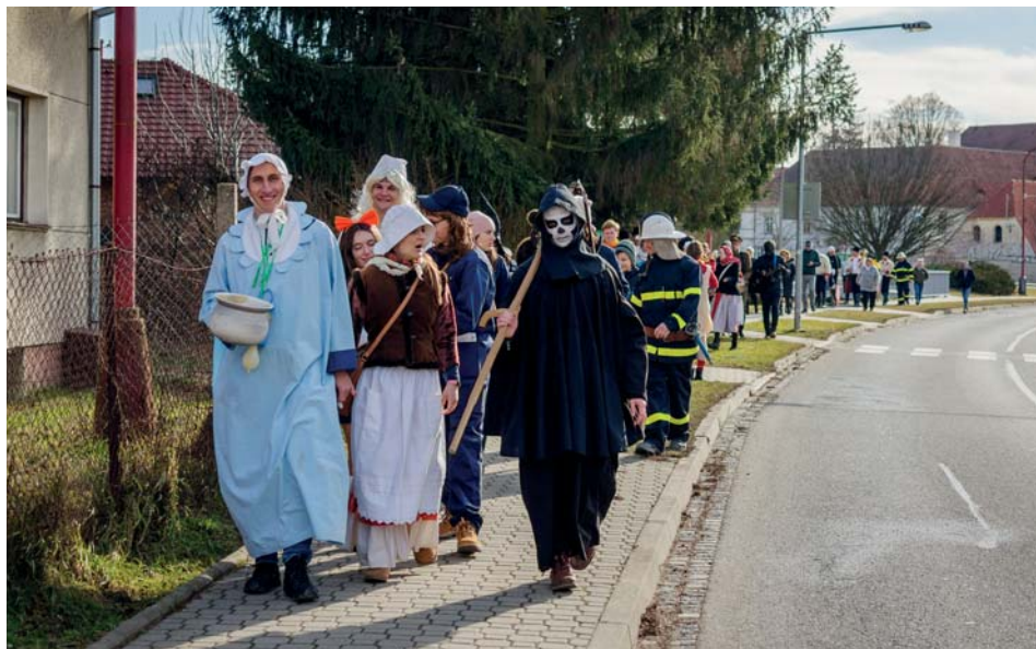
Fašankový průvod v části obce Podsedky