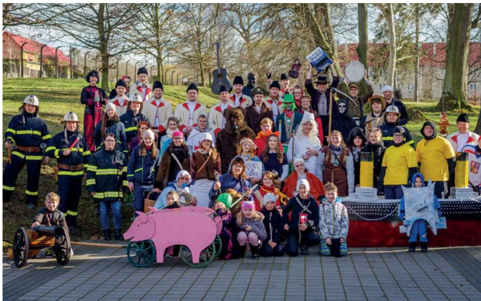
Fašanková družina v zámeckém parku