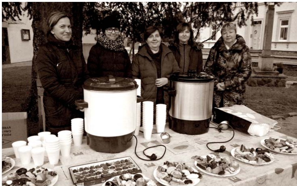
Dobroty pro návštěvníky nabízel osvědčený tým.