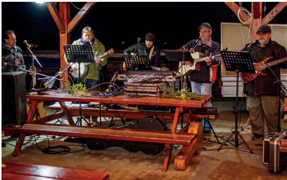
Tradiční štěpánské koledování s Jižany