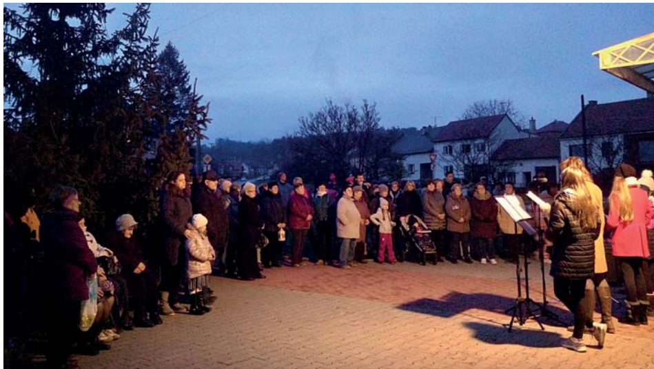
Rozsvícení stromu u kostela