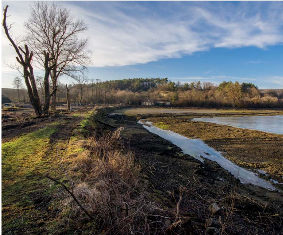
Revitalizace rybníka Hluboček probíhá.