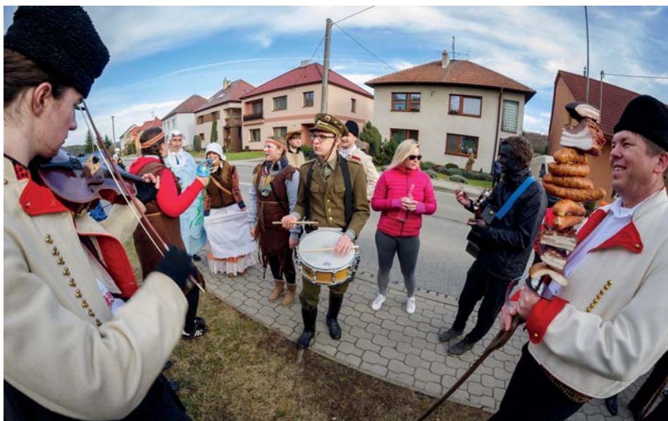
Přejme si, ať nám život v roce 2020 plyne ve zdraví, v hojnosti a v radosti.