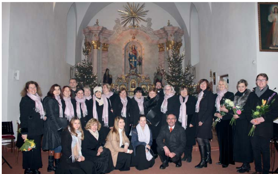
Novoroční koncert Chrámového sboru Březolupy