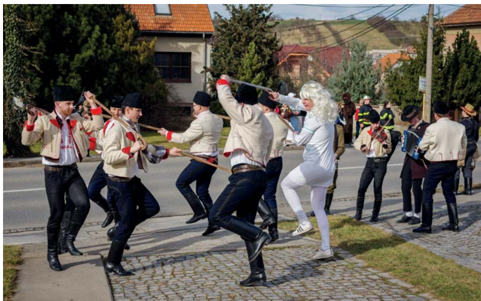
Fašankový průvod na Zápole