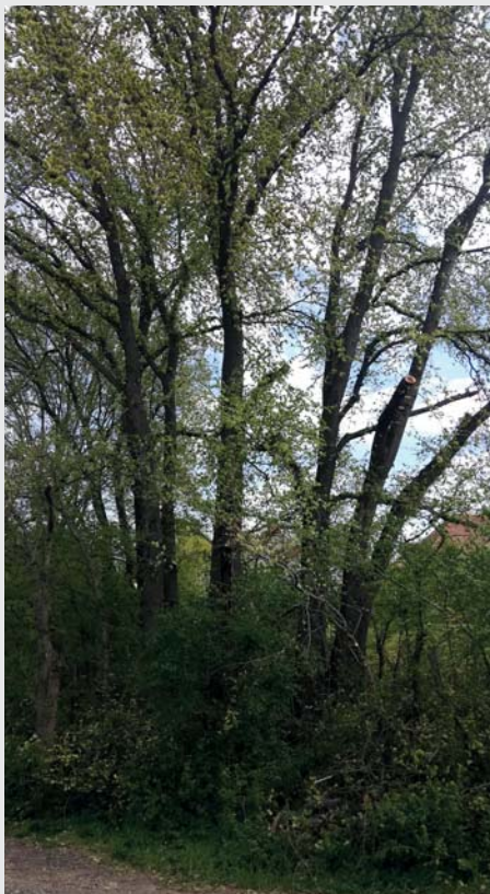
Na základě upozornění občanů, za které děkujeme, byly realizovány bezpečnostní a zdravotní ořezy dřevin Za Ohradů.