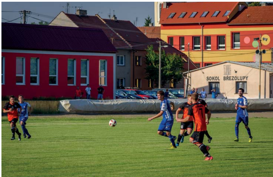
Fotbalový zápas Březolupy - Bílovice