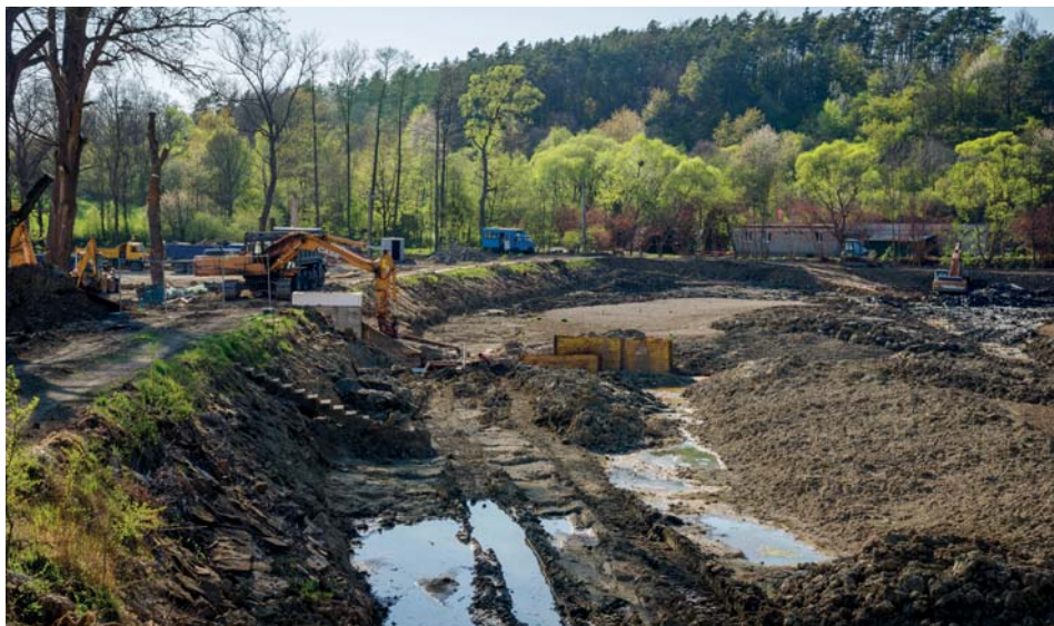
Rybník Hlubočky v současnosti