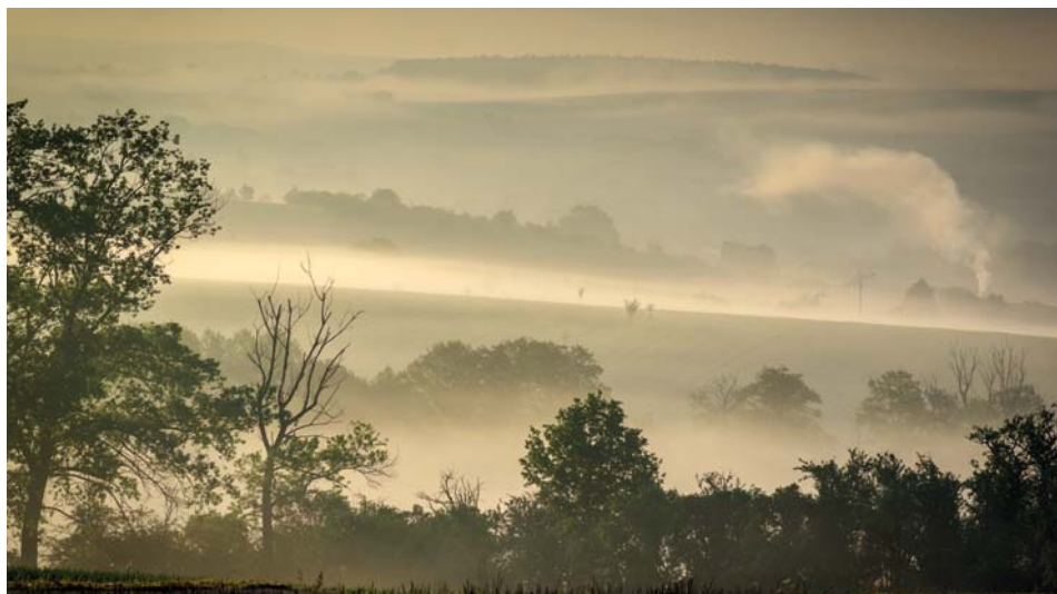
Březolupy v mlhavém ránu