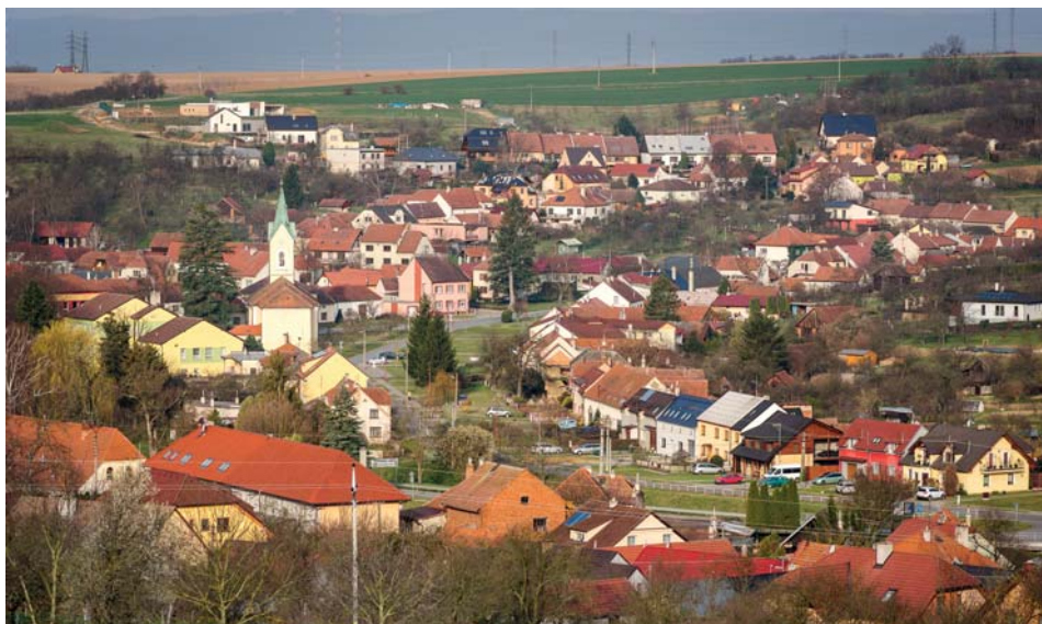
Pohled od Jezera