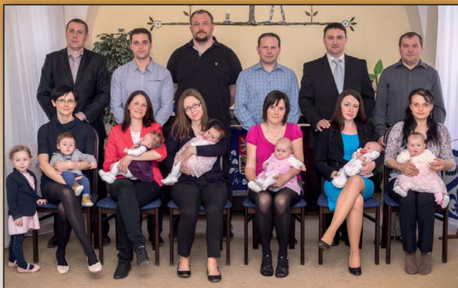
Omylem jsme v minulém zpravodaji nezveřejnili foto z vítání občánků, které se konalo 1. dubna 2017. Omlouváme se a i vás vítáme mezi námi.