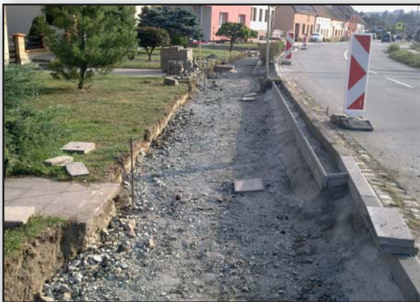
Rekonstrukce chodníků v Zápolí – hotovo by mělo být do konce roku.