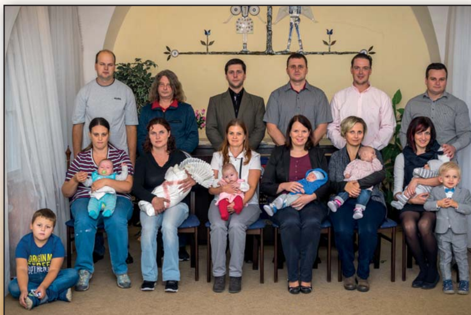
V sobotu 23. září 2017 jsme v obřadní síni přivítali další nové občánky.