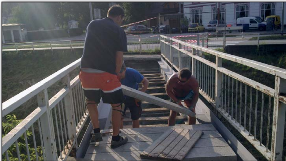
Společně s chodníkem v Zápolí se rekonstruuje i lávka pro pěší přes potok v parku za zdravotním střediskem.