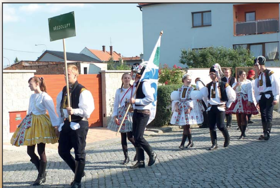
Slavnosti vína 2017