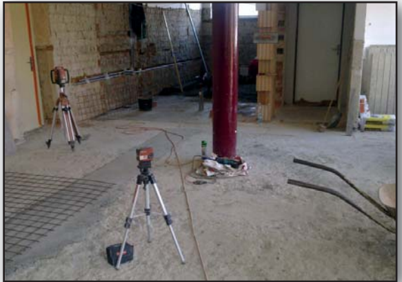
Rekonstrukce WC v hale

- v současné době již ve zkušebním provozu