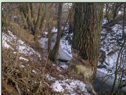
Činnost bobra – potok pod ČOV