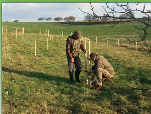
Podzimní výsadba na skládce - Myslivecké sdružení