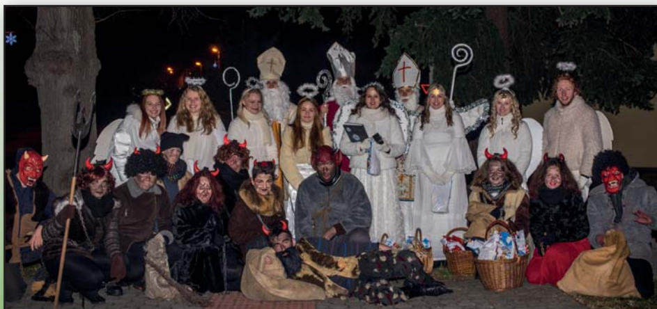
Dědinů chodí Mikuláš....