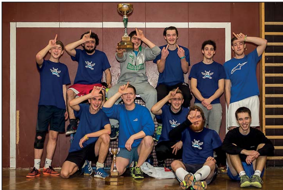
Tým REMÍZA - vítězové Štěpánského turnaje 2016.

Vítězství v dosavadní historii vybojovalo šest mužstev: ZÁPOLÍ - 6x, NAZDÁRCI - 5x, NEVĚSTY, ŽLEBY a DYNAMO CHMATOV - 2x, DRAHY a REMÍZA - 1x.