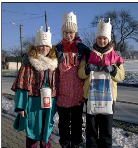
Tři králové v Zápolí