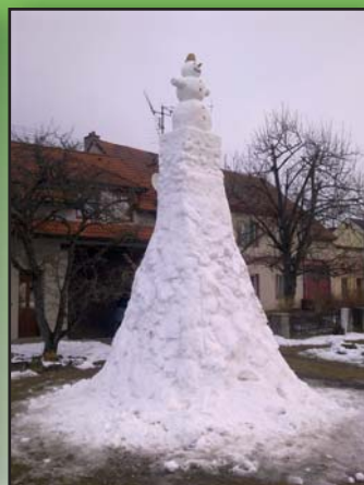
Sněhulák u Tručlů