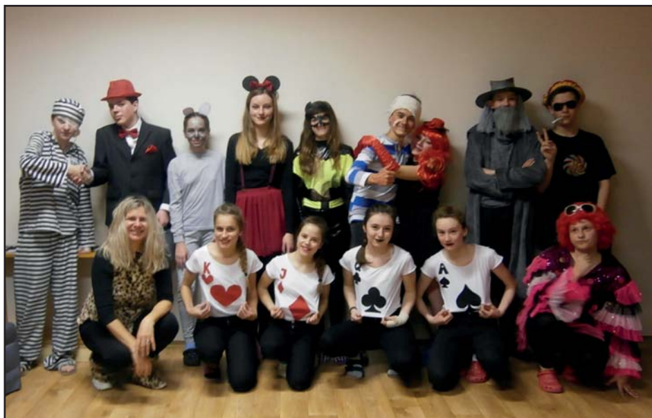
Večerní zábava po celodenním lyžování