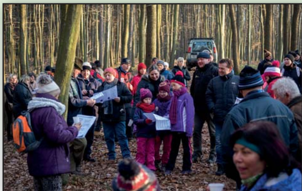
Předsilvestrovský výšlap na hrad Šarov