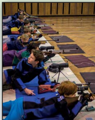
Střelci - Vánoční kapřík