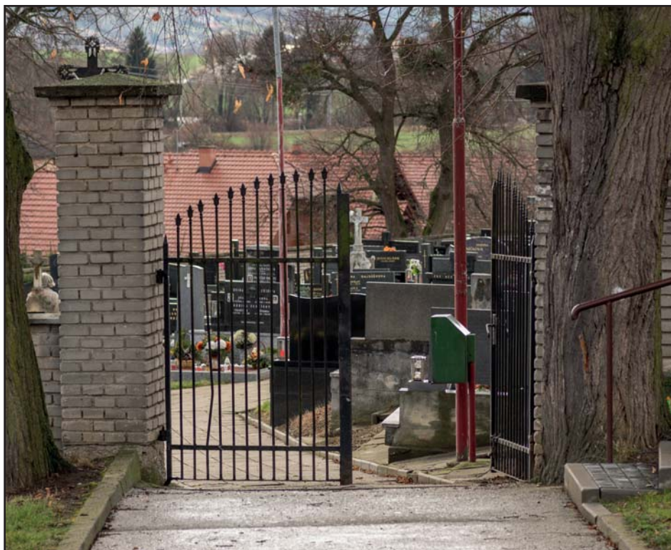
Plánovaná rekonstrukce hřbitova