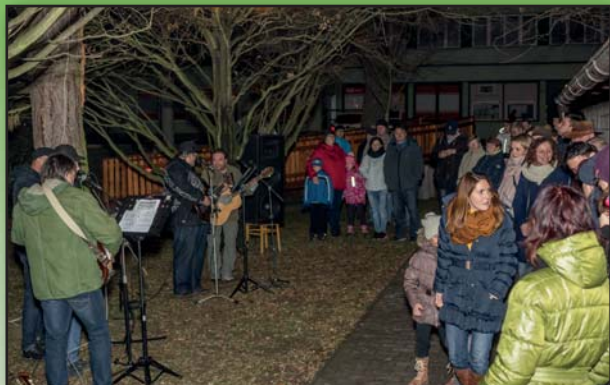
Jižané – Zpívání pod borovicí