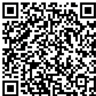
QR kód iOS

Nová aplikace vám rychle pomůže najít sběrný dvůr, obchod s elektrem, supermarket, obecní úřad, nebo další místa ve vašem okolí, kde jsou umístěny sběrné nádoby. Aplikaci si můžete zdarma stáhnout do mobilního telefonu nebo tabletu s operačním systémem Android nebo iOS. Kromě mapy sběrných míst aplikace navíc obsahuje přehledný popis jednotlivých druhů světelných zdrojů a kvíz na procvičení znalostí.