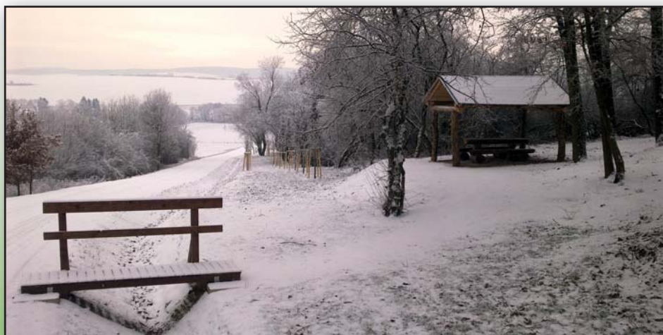
Altán směr Topolná