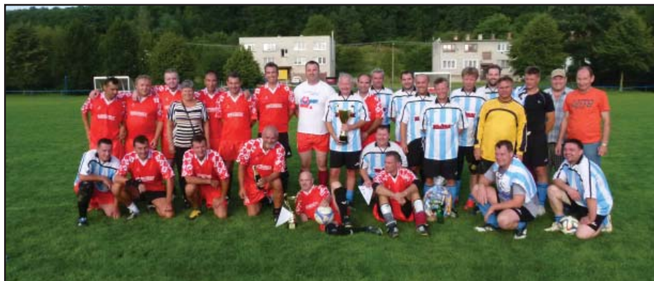
Týmy borců z Březolup a Brezolup po odehraném fotbalovém zápase