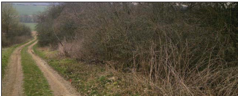
Polní cesta Toplná před rekonstrukcí...