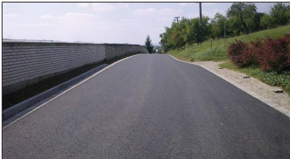
Zrekonstruovaná MK Nad hřbitovem