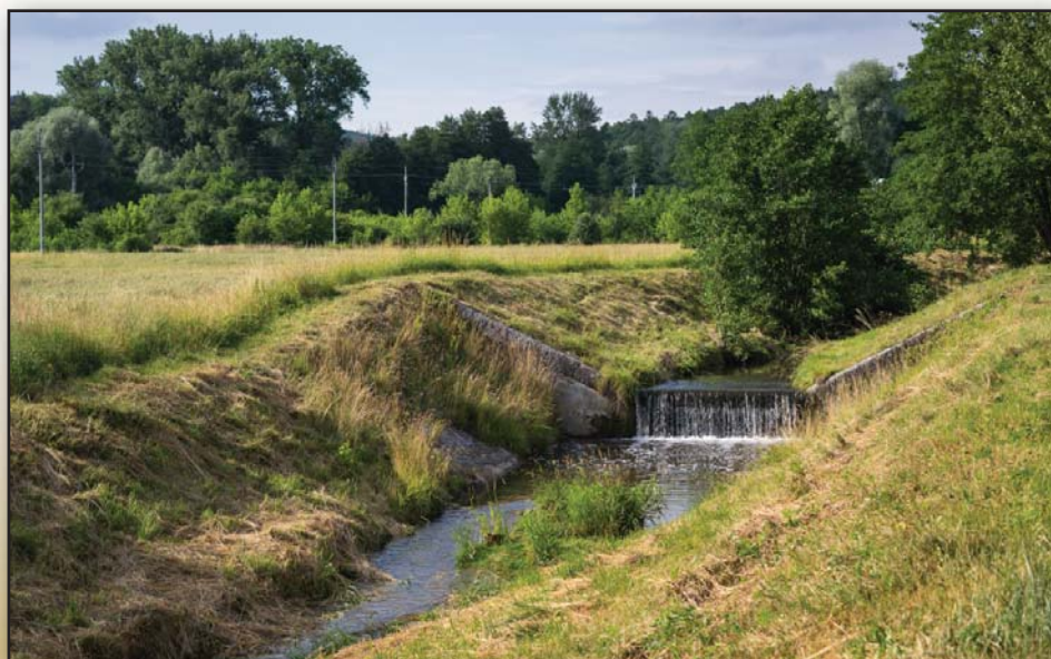
V naší obci je opravdu krásně. Potok Březnice pohledem Marka Michalíka