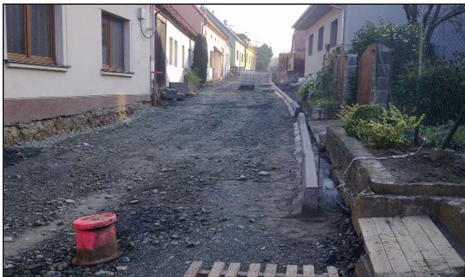
Rekonstrukce MK Kozina