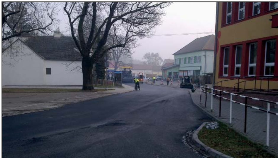
Revitalizace centra naší obce