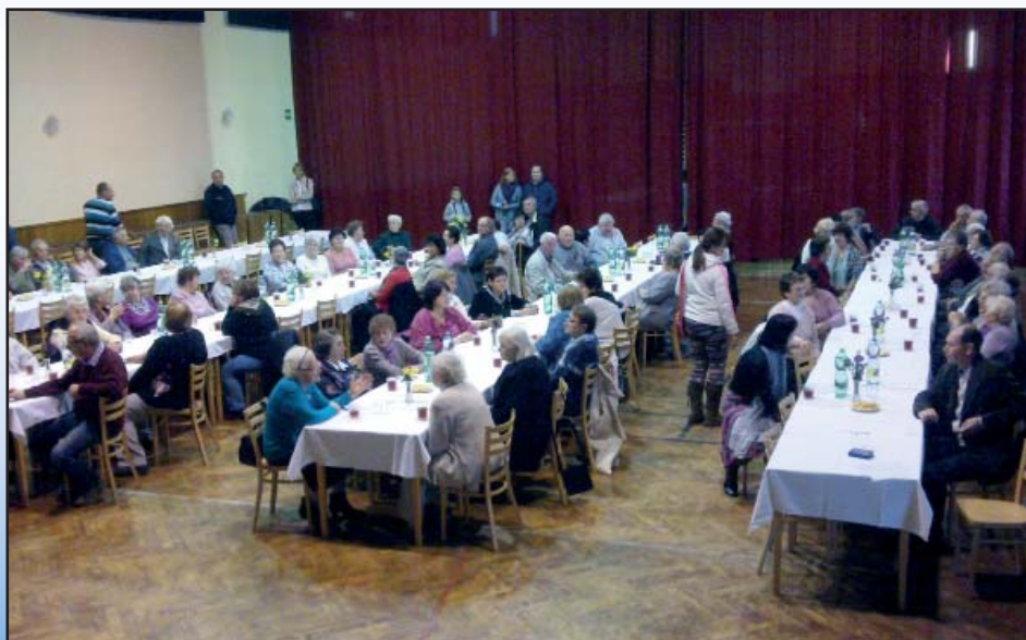
Beseda s dříve narozenými občany dne 8. 11. 2015