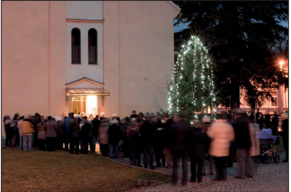
Rozsvěcování vánočního stromu