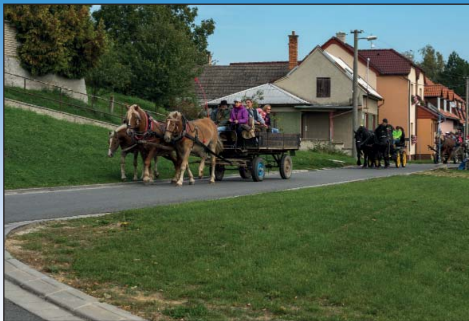
Setkání formanů 2015