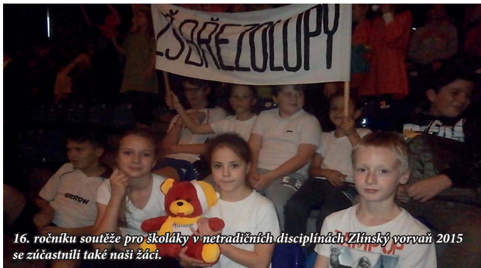
16. ročníku soutěže pro školáky v netradičních disciplínách Zlínský vorvaň 2015 se zúčastnili také naši žáci.