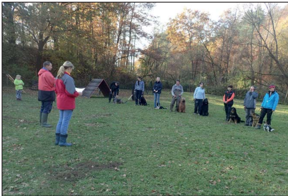
Z činnosti kynologického klubu