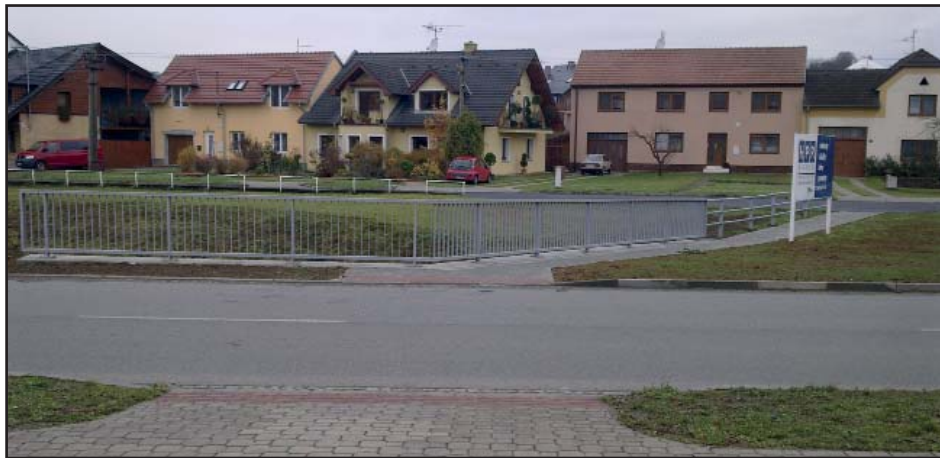
Nový chodník na mostu Podsedky