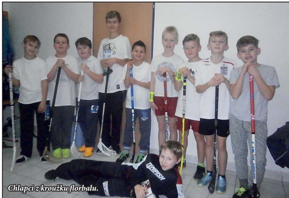
Chlapci z kroužku florbalu.