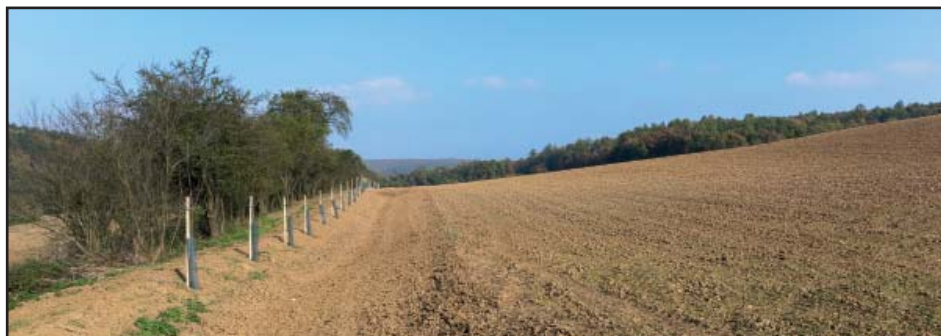
Součástí rekonstrukce mostu na Zelnici bylo i protierozní opatření PEO9 spolu s výsadbou celkem 53 stromů.