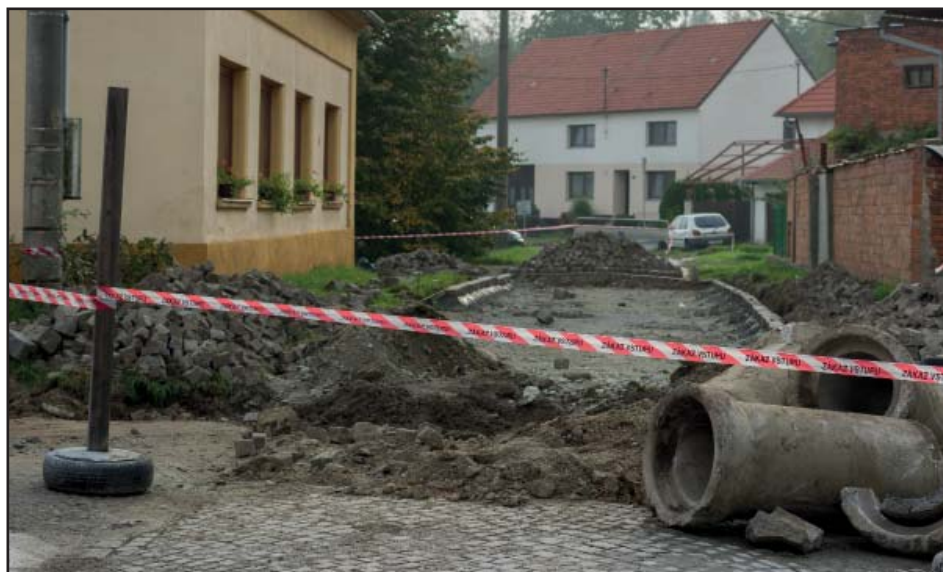
Místní komunikace s povrchem ze žulové kostky u pekárny se dočkala rekonstrukce.