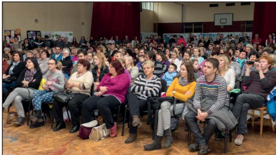
Již po čtrnácté se v sobotu 6.12.2014 otevřely „brány“ březolupského vánočního jarmarku.