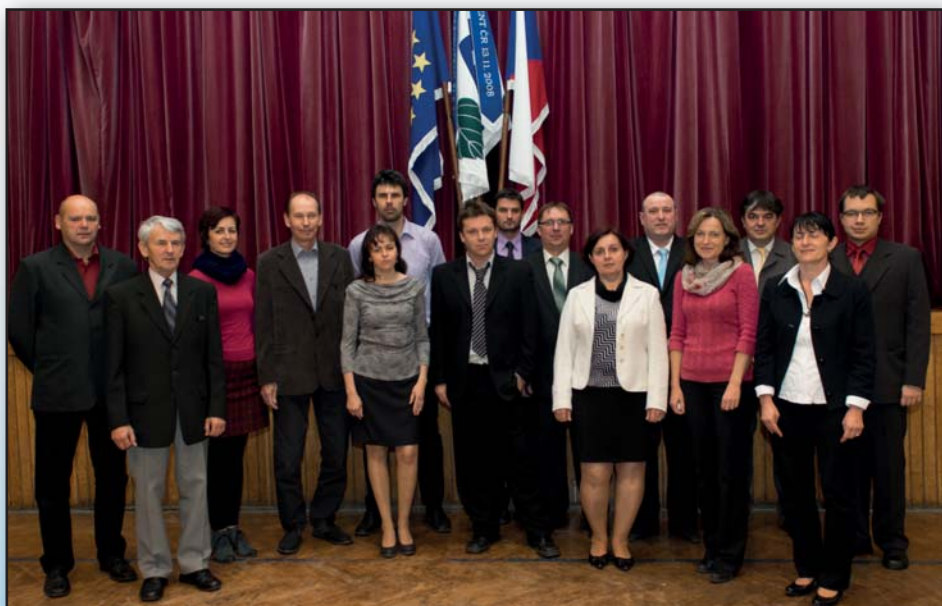
Nově vzešlé zastupitelstvo naší obce pro volební období 2014-2018. Jmenovitě viz. článek.