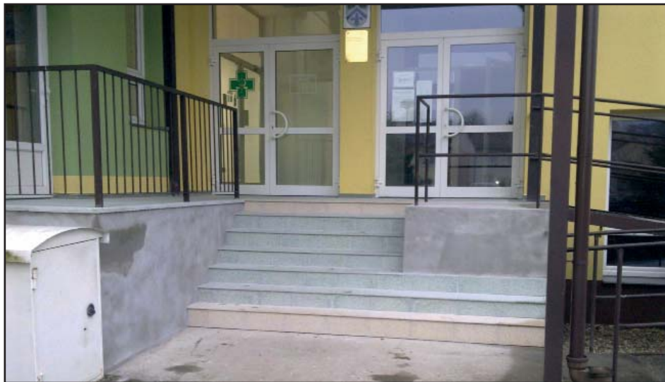
Venkovní schodiště na zdravotním středisku se dočkalo nového kabátu. Jak se Vám zamlouvá?