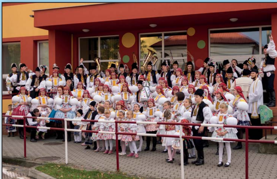
Letošních hodů (18.10.2014) se zúčastnilo 27 krojovaných párů a mnoho krojované drobtiny. Bohužel se ani letos stárci nenašli. Snad to bude v příštích letech lepší.