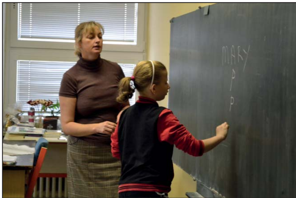
Výuka s rodilým mluvčím

V říjnu proběhl tradiční podzimní sběr papíru.Nejlepšími sběrači školy se stali Duda Jakub- nasbíral 315 kg, Ondroušek Miroslav se 260 kg, Hájková Barbora nasbírala 205 kg, Tručla Lukáš se 138 kg, Zapletalová Lucie se 138 kg, Keslerová Sofie se 125 kg, Gajdošíková Amálie se 110 kg, Blažek Radim se 100 kg, Lacinová Rozálie se 100 kg, Petrželka Vít se77 kg. Nejlepší třídou se stala 1.třída, kde žáci nasbírali celkem 967 kg papíru, na druhém místě skončila 3.třída se 797 kg a na 3.místě 2.třída s 534 kg. Za celou školu bylo nasbíráno 2 723 kg papíru.