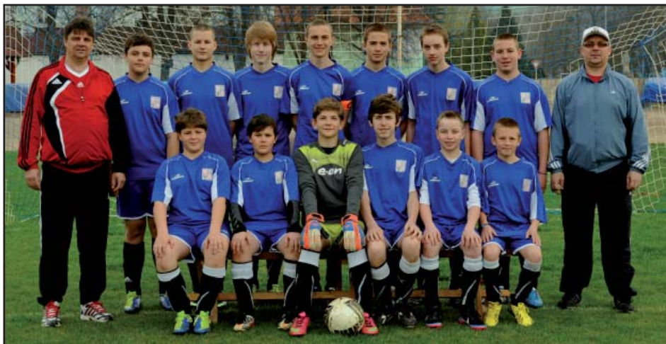
Žákovské mužstvo TJ Sokol Březolupy v sezoně 2012-13:

Po těchto výsledcích jsme po podzimu obsadili 2. místo se ztrátou 3 bodů na Havřice a náskokem 1 bodu na třetí Místřice. Celkově jsme měli suverénně nejlepší skóre 49:19 z osmi zápasů, a proto jsme přehodnotili své cíle a vyhlásili na jaře útok na okresní titul.