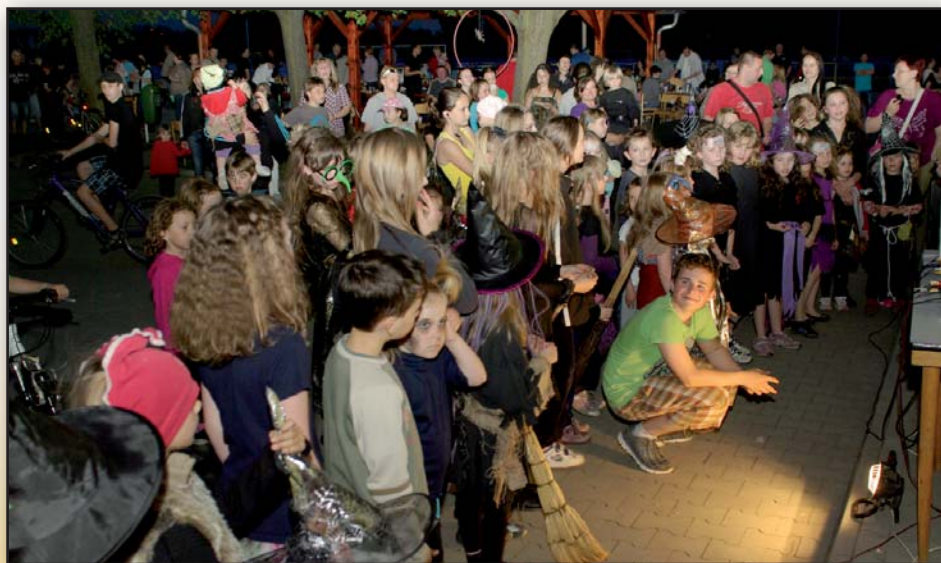
Pro letošek protáhli organizátoři pálení čarodějnic do pozdních odpoledních hodin a bylo zpestřeno ohňostrojem. Malým i velkým čarodějnicím se jistě jejich „slet“ líbil a už se těší na příští rok. Děkujeme SRPŠ Březolupy za vydařenou akci.