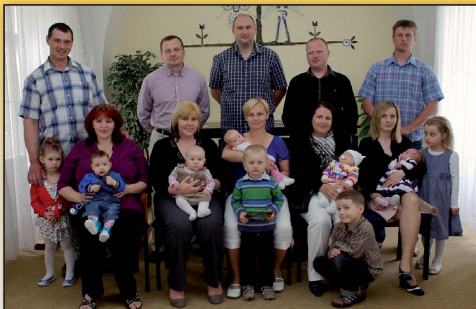
Vítejte mezi námi noví březolupjáči.