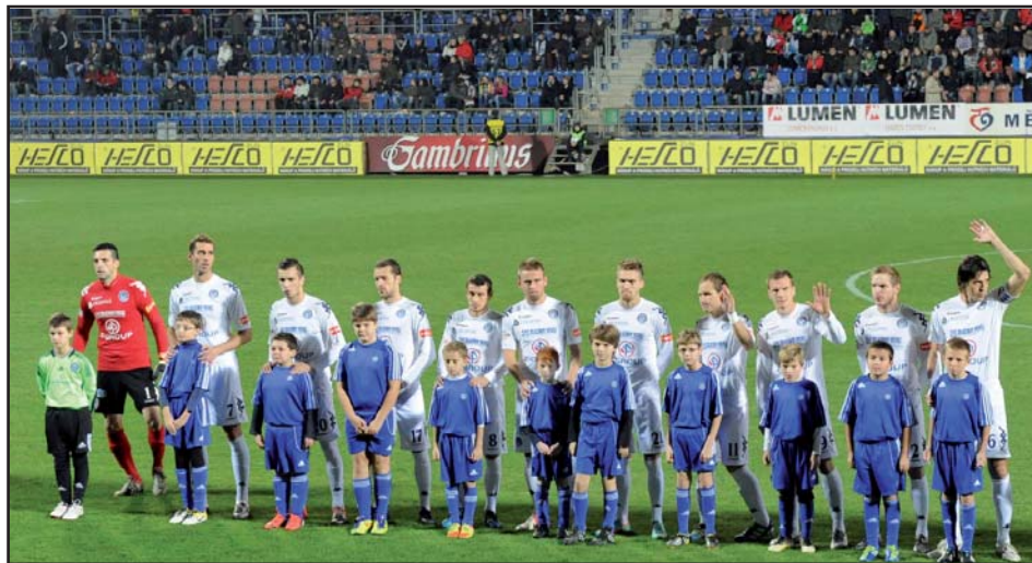
Přípravka doprovodila hráče k utkání 1. ligy 1.FC Slovácko – Sigma Olomouc.

tu čest doprovázet na hřiště před více než pěti tisíci návštěvníky hráče Slovácka a Olomouce k prvoligovému utkání, a v poločase si před touto návštěvou dokonce zahráli fotbal proti svým vrstevníkům ze Slovácka, což je jistě ta nejlepší reklama březolupskému fotbalu.